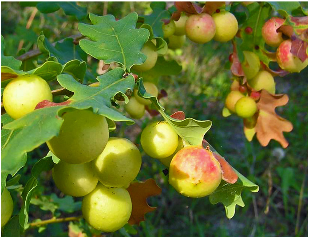
Galläpplen, en viktig ingrediens i medeltida bläck.